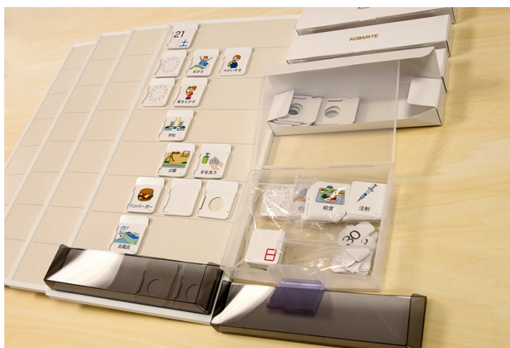
写真① コバリテ視覚支援スタートキット（デラックス）