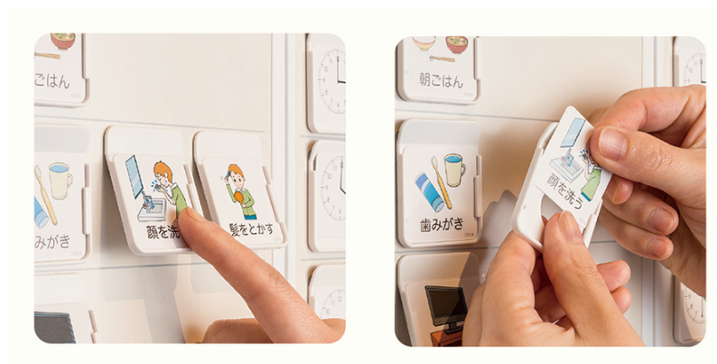
写真② 取り外しが簡単なデザイン 写真③ 増やせる構造