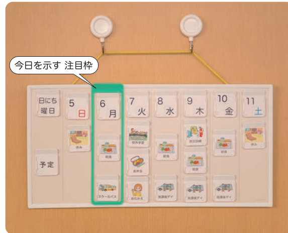
一週間カレンダーの例