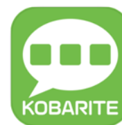
アプリのアイコン