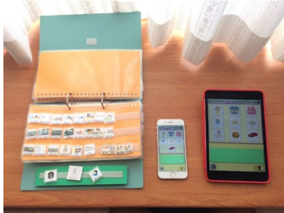
② 実物の絵カード・ブックとのデバイスの外観