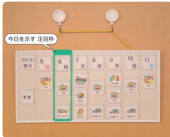
一週間カレンダーの例