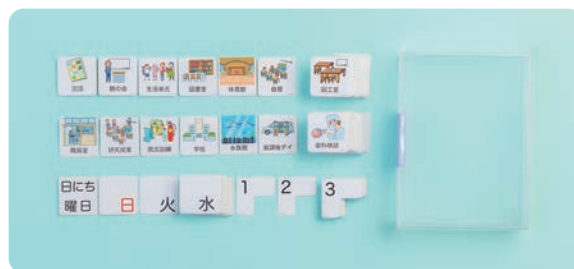
届いたその日から視覚支援をスタートできます

絵カードを増やす方法は、ホームページでご案内しています。「絵カードセンター」を検索してください。