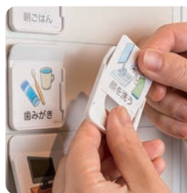
絵カードの差し替えが自由